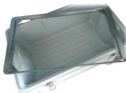
RÁM GN 1/1